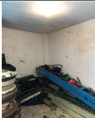
Deposito piso 1.