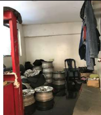
Oficina piso 2.