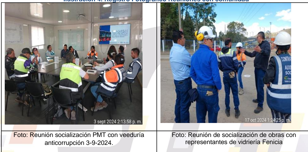
Ilustración 4. Registro Fotográfico Reuniones con comunidad