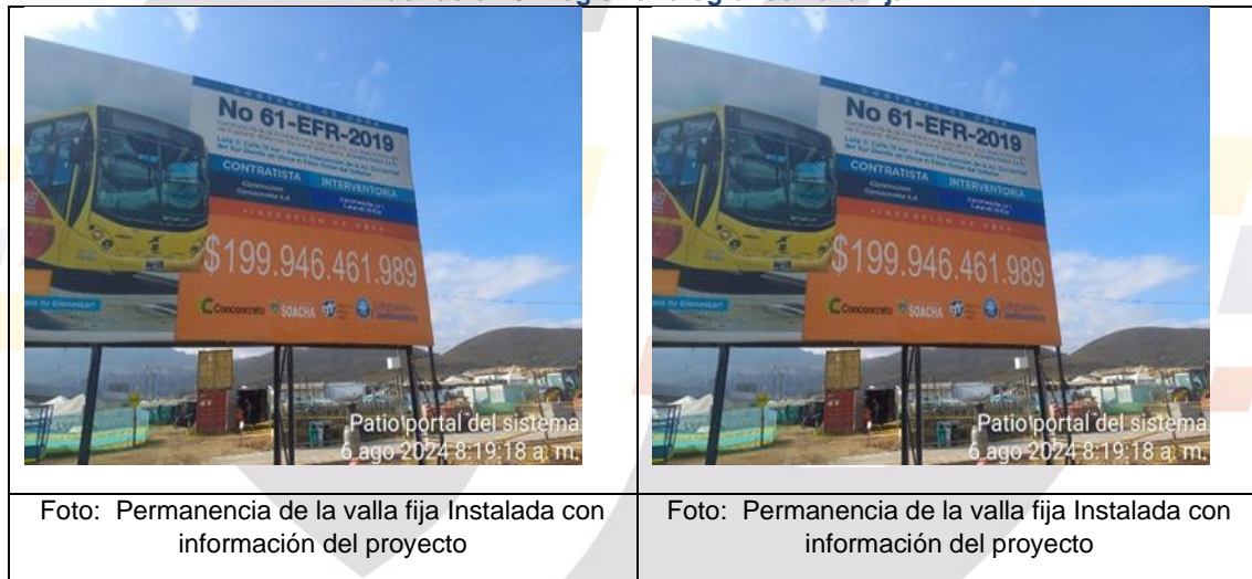
Foto: Permanencia de la valla fija Instalada con información del proyecto