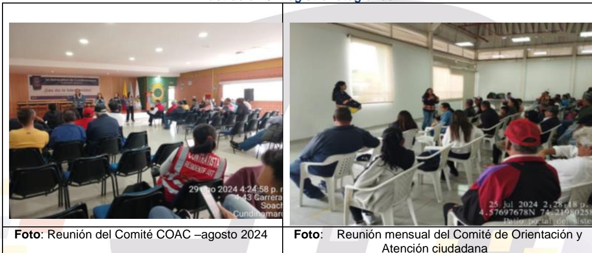
Ilustración 3. Registro fotográfico

disminuido la asistencia debido a condiciones de lluvia como lo fue en el mes de septiembre de 2024.