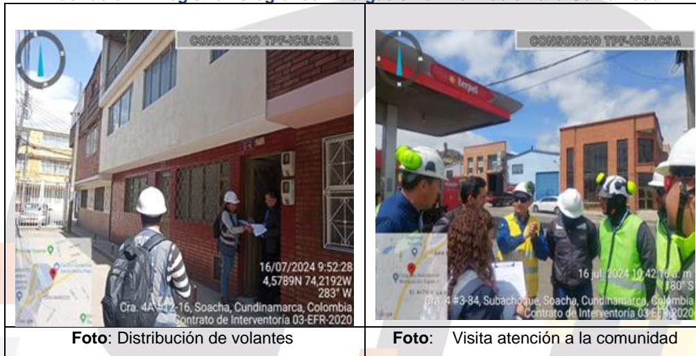
Ilustración 1. Registro Fotográfico Divulgación e información a la Comunidad

La Interventoría realizó el acompañamiento en la verificación y actualización de los 13 PSI con los que se cuenta hasta la fecha, así mismo verificó que se realizarán los mantenimientos requeridos, se revisó y firmó los formatos correspondientes.