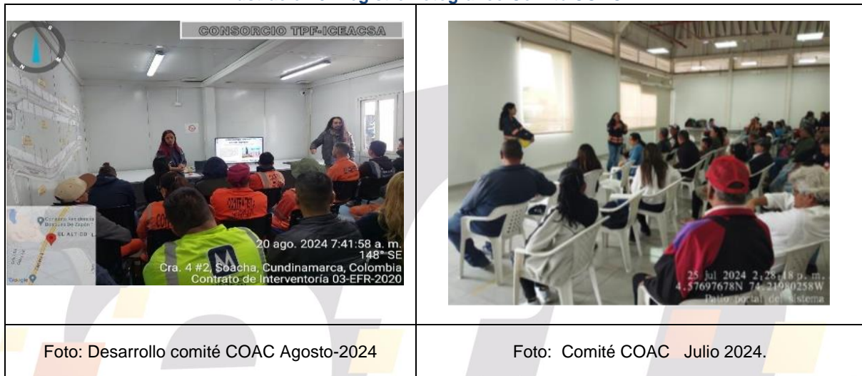
Ilustración 9. Registro Fotográfico Comité COAC